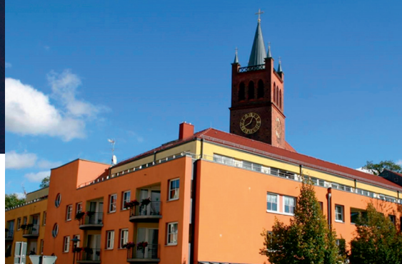
EHPAD Alzheimer - Müncheberg (Allemagne)*