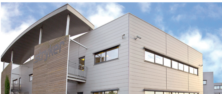
SIÈGE SOCIAL STRYKER - Pusignan (Lyon)*