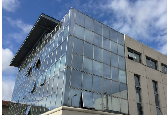
CABINET DE CONSULTATION CARDIOLOGIQUE - Bordeaux*