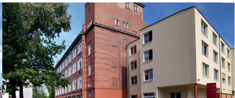
EHPAD Alzheimer - Guben (Allemagne)*