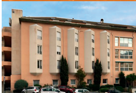
EHPAD Alzheimer - Bastia*

*Investissements déjà réalisés qui ne préjugent pas des investissements futurs.