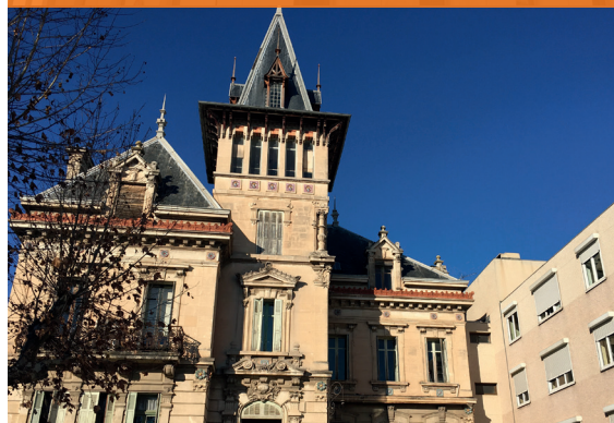
CLINIQUE MCO - Salon de Provence*